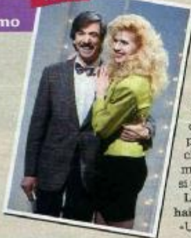
Per Lorella Cuccarini: trucco Anna Di Florio per V. Giulia IV, Roma; acconciatura Mauro Dal Proto per V. Giulia IV, Roma. Si ringrazia per la collaborazione Francesco Casarino - Si ringrazia UNA Hotel Versilia a Lido di Camaiore