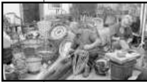
Artigiani al lavoro alla "Fiera dei saperi" di Rivoreta

CUTIGLIANO. Domenica torna a Rivoreta, nel comune di Cutigliano dalle 10 alle 19, l'ormai tradizionale "Fiera dei saperi". Anche quest'anno il borgo montano si trasformerà per un'intera giornata in una grande "fucina delle arti e dell'artigianato", dove artigiani ed artisti esporranno e venderanno i loro prodotti e mostreranno i segreti del loro lavoro.