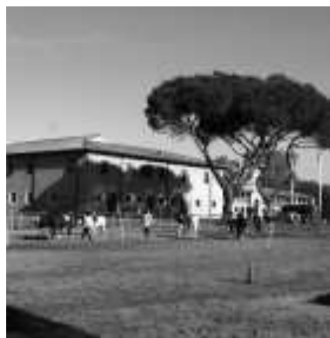
San Rossore, che ospita la manifestazione

Fra le altre curiosità, la possibilità di visitare una casa ecologica, che sarà allestita in piazza Mazzini, e il progetto dell'Orto di Monte Alfonso nell'omonimo castello, complesso seicentesco di Castelnuovo Garfagnana che sta diventando un luogo simbolico del mondo bioecologico, dove viene portato avanti un progetto ecosostenibile nel recupero delle aree verdi, con un orto con piante autoctone. L'orto sarà trasportato in parte in piazza Mazzini e sarà alla base di un quiz al termine del quale il bambino più bravo si guadagnerà il titolo di "signore di Montalfonso".