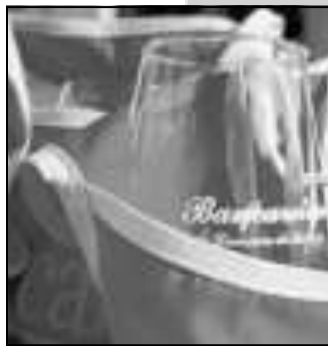
I bicchieri di Bancarel'vino edizione 2008

MULAZZO. Più di duecento enoteche, fra le più prestigiose selezionate in tutta Italia, hanno dato il proprio contributo a "Bancarel'vino", il concorso che premia i vini più venduti.