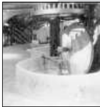
Un frantoio per la produzione dell'olio